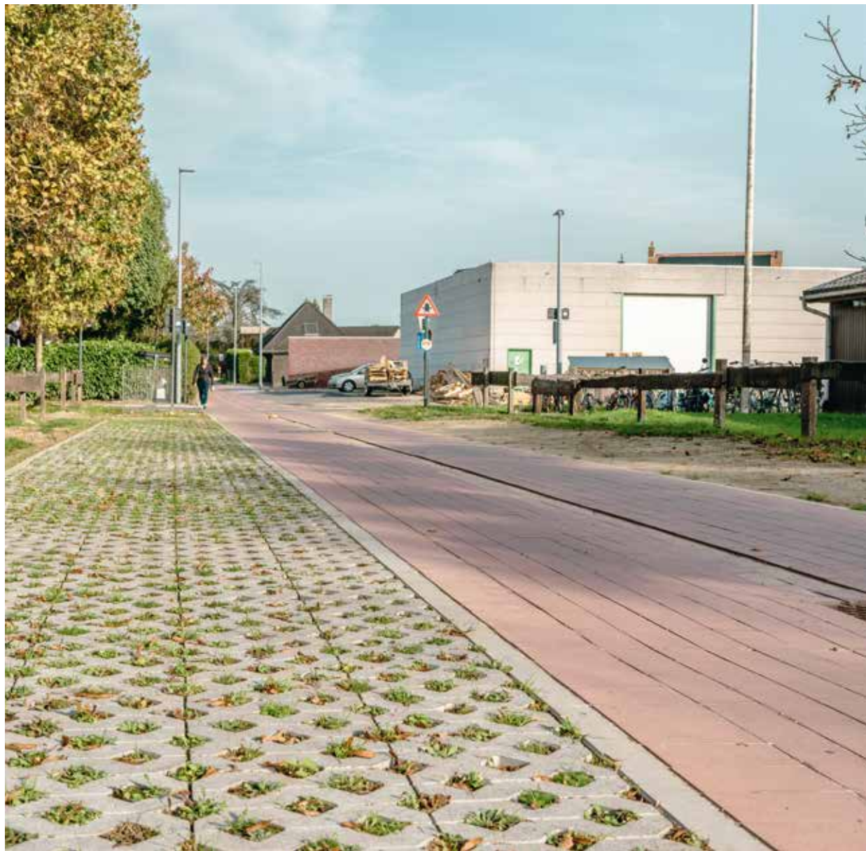
Fietsdoorsteek tussen de Brugsesteenweg en de Gitsestraat

Naast de Honzebroekstraat, waren de nutsmaatschappijen en aannemers ook op andere plaatsen actief in jouw omgeving.