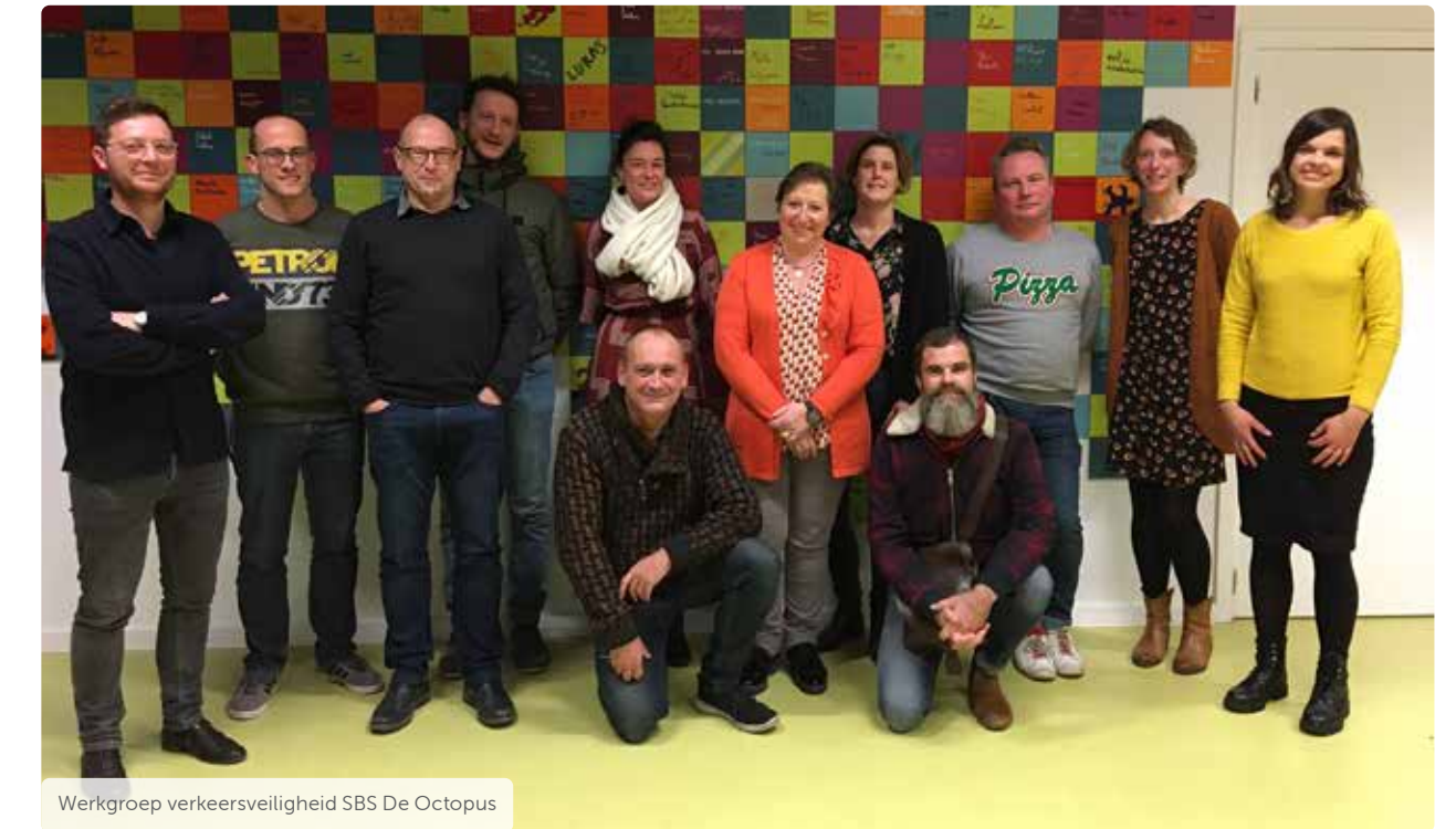
Werkgroep verkeersveiligheid SBS De Octopus